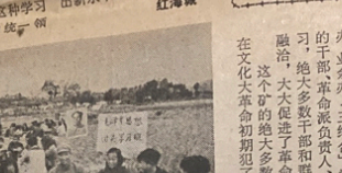
在无产阶级文化大革命的空前大好形势下，各种类型的毛泽东思想学习班如雨后春笋，遍及全国各地。这是江西兴国县县长岗公社长岗大队婚育生学队的革命群众在田头毛泽东思想学习班，认真学习毛主席的光辉著作。

导，又能发动广大工人参加，大家既是教员，又是学员。谁毛泽东思想学得最好，用得最活，谁就担任辅导。通过不断学习，不断改善干部和群众的关系。大家认为：要办好有工人参加的毛泽东思想学习班，必须保持群众办学，民主办学的方针，这样才能把学习班办得更有成效，办出水平。