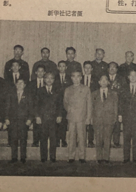
下图：一月十八日，周恩来总理接见了日本社会党国会议员石野久男、枝村要作，以藤原丰次郎为首的日本千叶县友好人士代表团，以松本康行为首的日本社会党国会议员秘书学习团。图为接见时合影。

新华社十八日讯 周恩来总理今天接见了正在北京访问的日本社会党国会议员石野久男、枝村要作，以藤原丰次郎为首的日本千叶县友好人士代表团，以松本康行为首的日本社会党国会议员秘书学习团，同他们进行了友好的谈话。